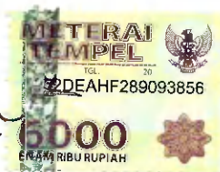
ADRIANUS OKOKA, S.Sos