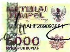
ADRIANUS OKOKA, S.Sos