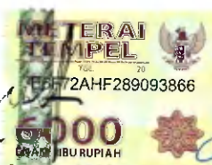
ADRIANUS OKOKA, S.Sos